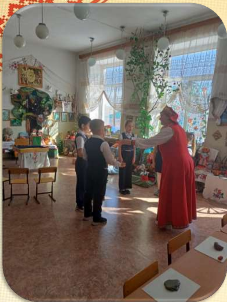
Приветствие детей Сказочницей