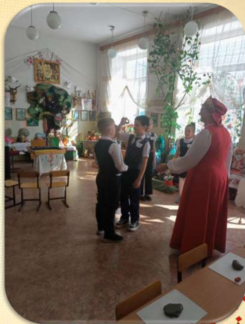
Игра «Волшебные очки» «Скажи друг другу комплимент»