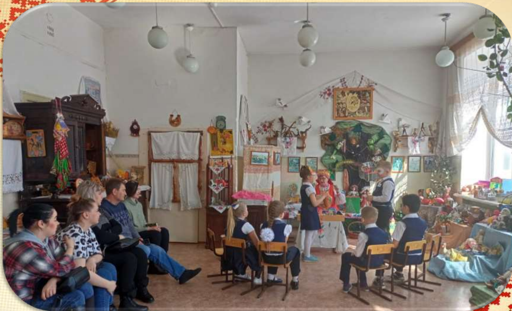
Инсценировка русской народной сказки «Лиса и Журавль»