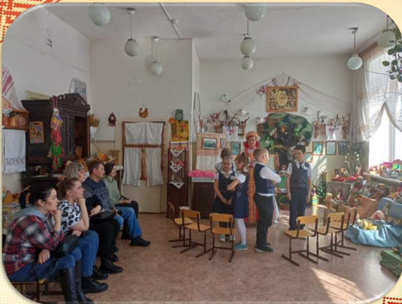
Пляска «Поссорились – помирились»