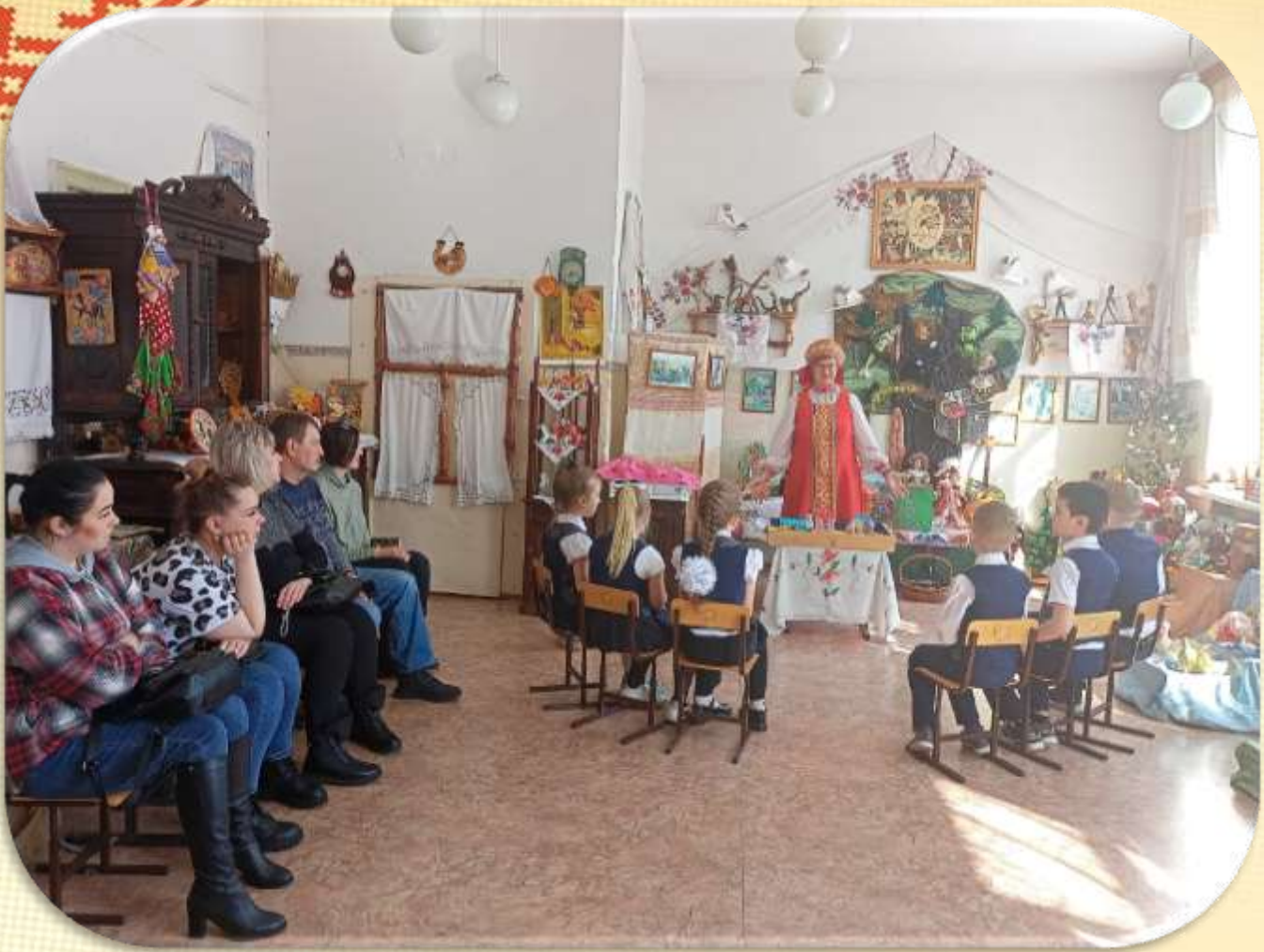
Дети построили в песочнице «Волшебную страну Чувств»