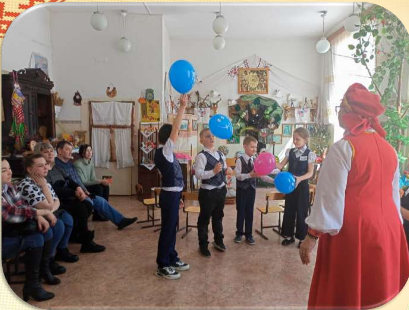
Выход из сказки на воздушных шариках